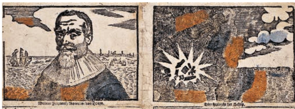
Schipper Bontekoe en de ontloffing van zijn schip (Rijksmuseum)

Op Burendag wordt het Bontekoe park officieel geopend. Reden voor een feestje! Wat is er te doen?