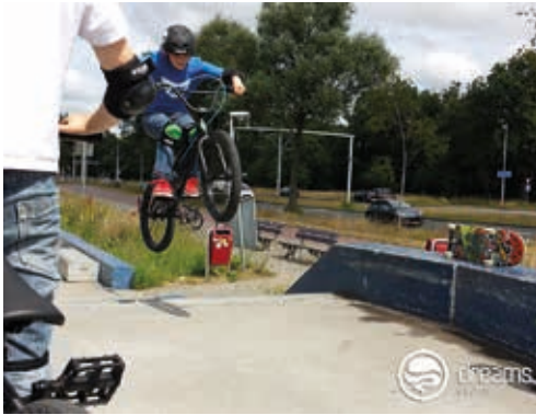
BMX en Longboarden

Kom ook leren BMX-en of Longboarden! De instructeurs van skateschool Dreams geven twee workshops longboarden en twee workshops BMX. Daaraan kunnen 10 kinderen per keer meedoen, in totaal zijn er dus 40 plekken. Voor een helm en beschermers wordt gezorgd.