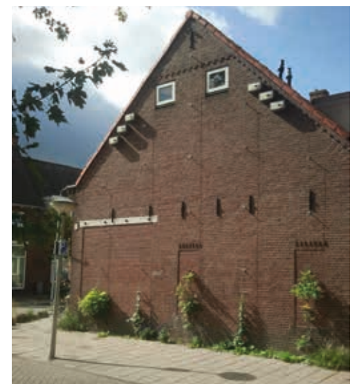
groene wand Trompstraat

Binnenkort worden de bewoners van huizen die aan deze criteria voldoen benaderd. Als er budget overblijft, dan worden ook bewoners van huizen met een blinde gevel uit andere straten benaderd.