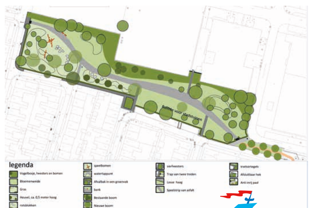
Definitief Ontwerp Bontekoe park

De uitvoering van het parkontwerp liep vertraging op. Om dit gebied in een keer goed her in te richten besloot de gemeente de 'Bult' te saneren: daar was eind jaren 80 vervuilde grond ingepakt opgeslagen. Daarna is er ook asbestonderzoek gedaan in de hele Bontekoezone. Op enkele plekken lag dat er ook. Begin 2019 is een groot deel van de Bontekoezone gesaneerd en is er nieuwe schone grond opgebracht.