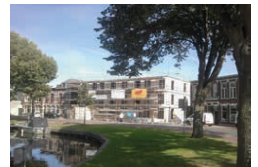
nieuwbouw Zijlsingel 36

De planning voor de oplevering is april 2020. Er komen 46 vrije sector huurwoningen.