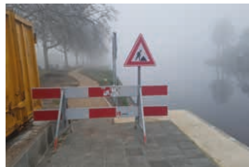
aanleg wandelpad Rijn-Schiekanaal

Afgelopen voorjaar is een wandelpad langs het Rijn-Schiekanaal aangelegd. Hierbij een foto van de aanleg.