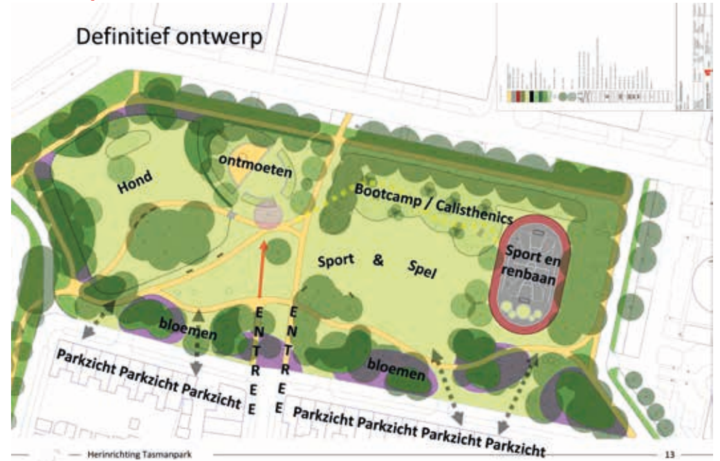
definitief Ontwerp Tasmanpark

In 2014 is door de buurtbewoners in de Wijkvisie vastgelegd dat het park in de toekomst het centrale hart van de wijk moest worden, met ruimte voor mooier groen, spelen, sporten, verblijven en ontmoeten. Ook zou er een ruimte komen voor activiteiten (de kiosk). In 2017 organiseerde het projectteam voor dit park een bewonersbijeenkomst om de wensen van bewoners te inventariseren. Daaruit kwamen: