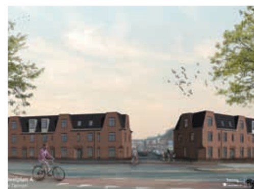
tekening nieuwbouw Portaal

Het zal niemand ontgaan zijn dat Portaal druk aan het slopen is in de Zeeheldenbuurt. Portaal gaat 36 sociale huur appartementen en 40 vrije sector huur eengezinswoningen bouwen. Na de sloop vindt het archeologisch onderzoek plaats in de grond. Portaal verwacht in het vierde kwartaal van dit jaar te starten met de