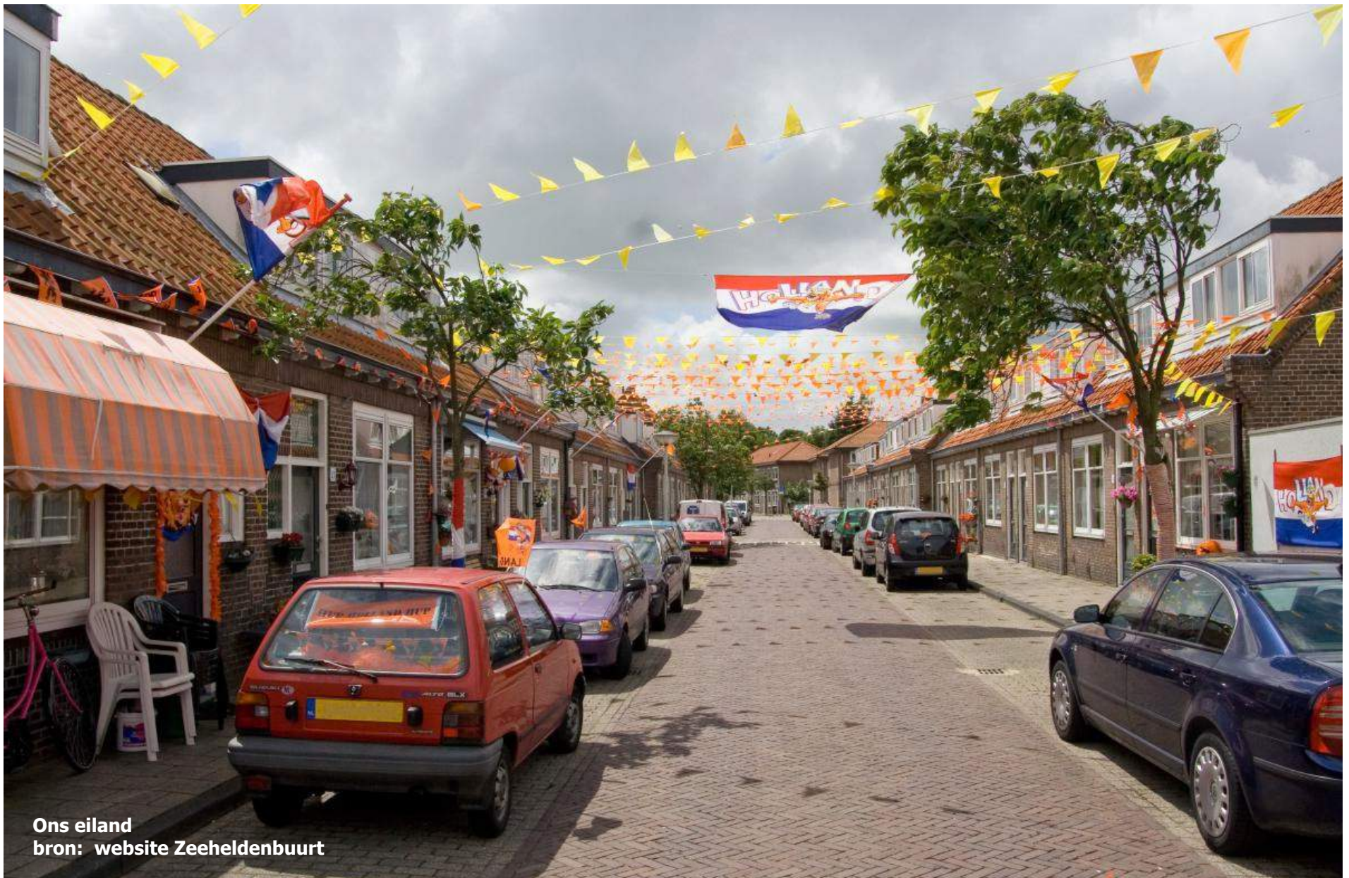
Ons eiland