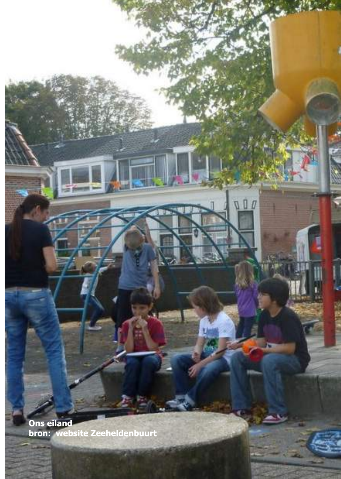
Ons eiland