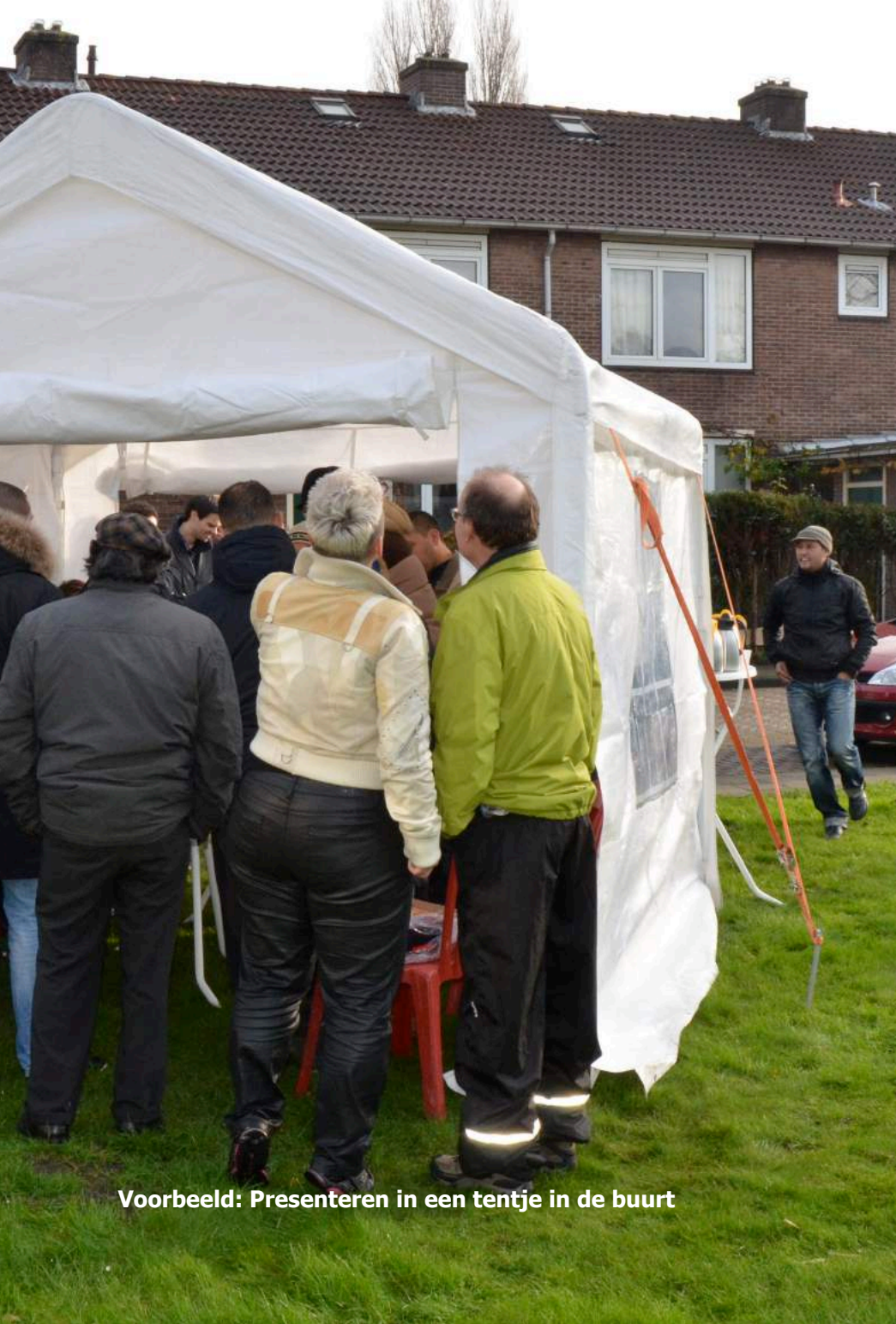
Voorbeeld: Presenteren in een tentje in de buurt