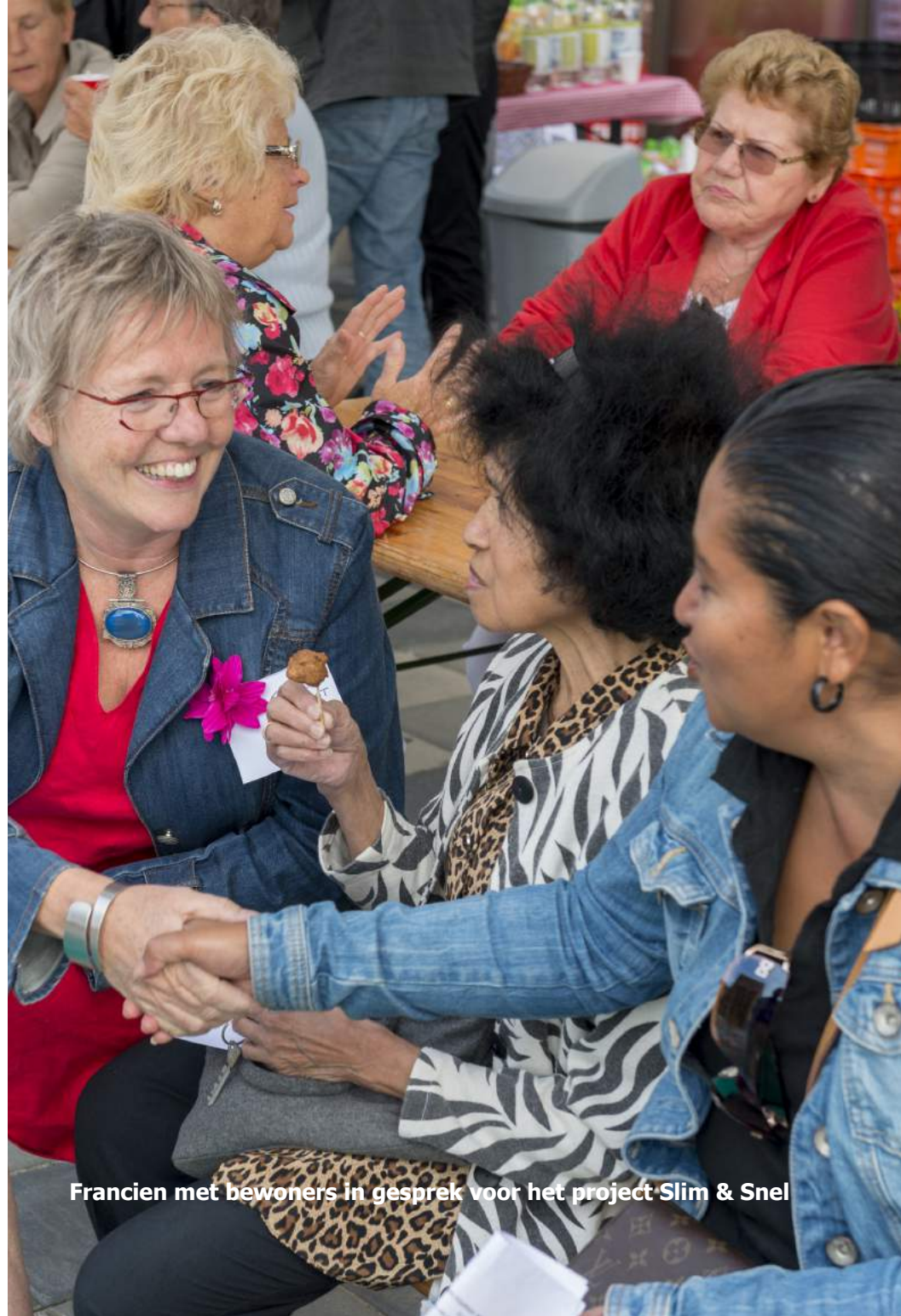
Francien met bewoners in gesprek voor het project Slim & Snel

Voor visualisatie van de wijkvisie wordt een assistent ontwerper betrokken.