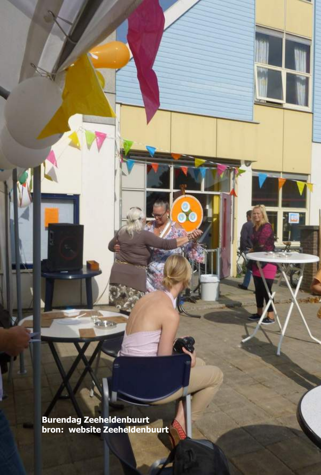
Burendag Zeeheldenbuurt