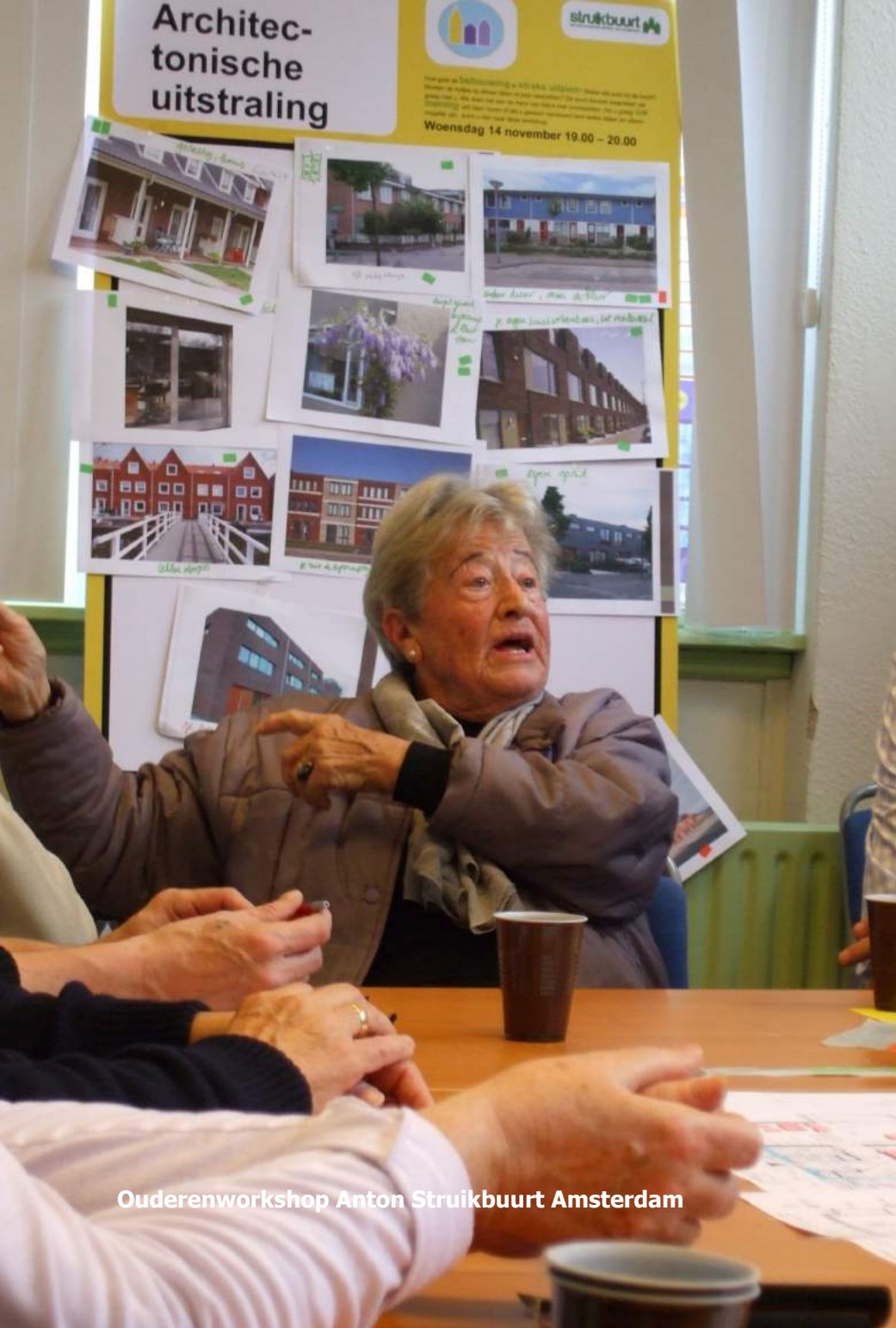
Ouderenworkshop Anton Struikbuurt Amsterdam