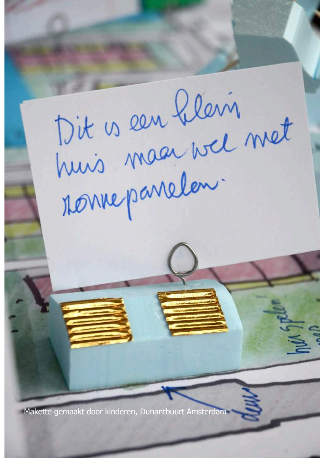
Makette gemaakt door kinderen, Dunantbuurt Amsterdam

Voor deze workshops is twee keer drie dagen een plek in de buurt nodig om te werken. Deze plek is al door de buurtvereniging genoemd en zou de speeltuin en/of het buurthuis kunnen zijn. Mogelijk kan er ook een leegstaande woning worden betrokken, maar dit is in de wintertijd wellicht niet uitvoerbaar. Het zou in ieder geval een 'hotspot' in de buurt moeten zijn en open voor iedereen die interesse heeft om bij een kopje koffie of een kop soep na werktijd mee te denken of vragen te stellen.