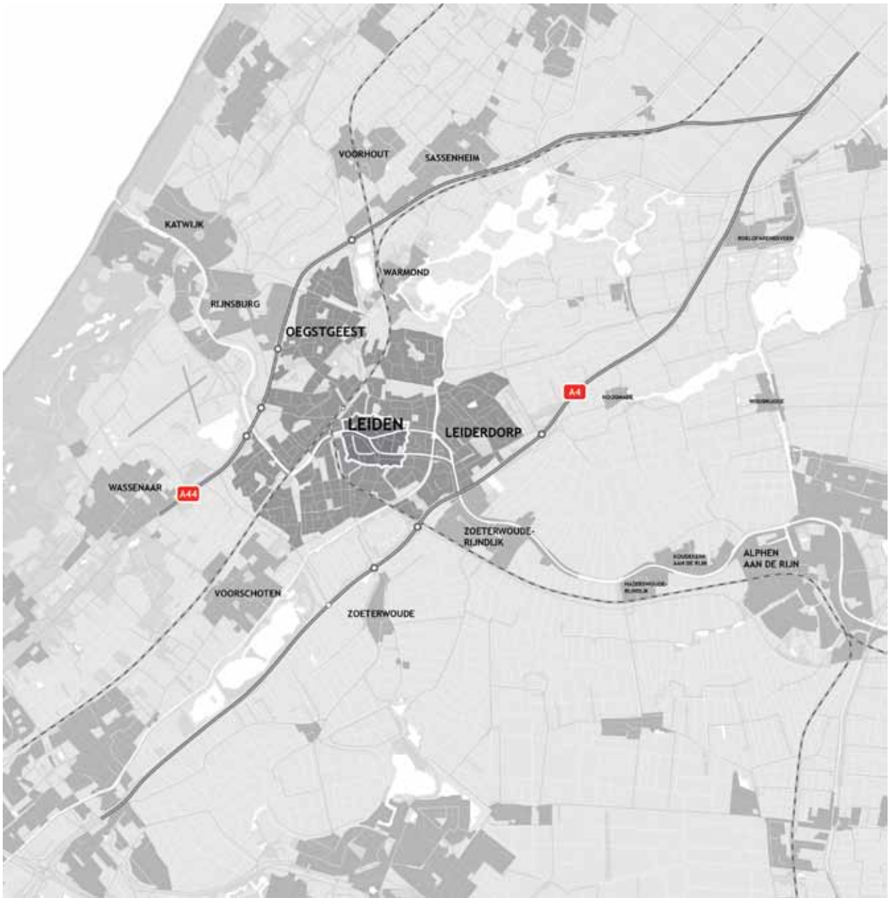
△ Figuur 1.1: Leidse Agglomeratie