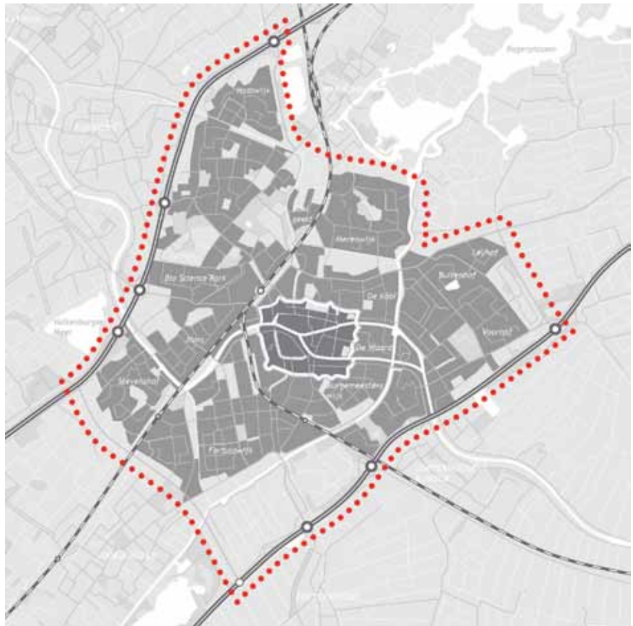
▷ Figuur 2.2: Studiegebied