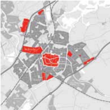
▽ Figuur 2.1: Gevoelde knelpunten